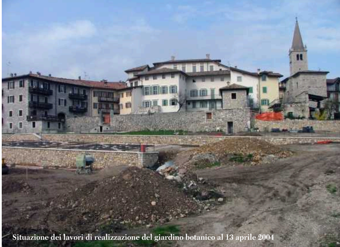
Situazione dei lavori di realizzazione del giardino botanico al 13 aprile 2004

pubblicazione della Flora Illustrata del Monte Baldo, che sarà stampata nel 2009 e nella quale a fianco dell'immagine di ciascuna specie spontanea baldense, verrà presentata una carta di distribuzione a punti, oltre ad alcune note critiche e curiosità.