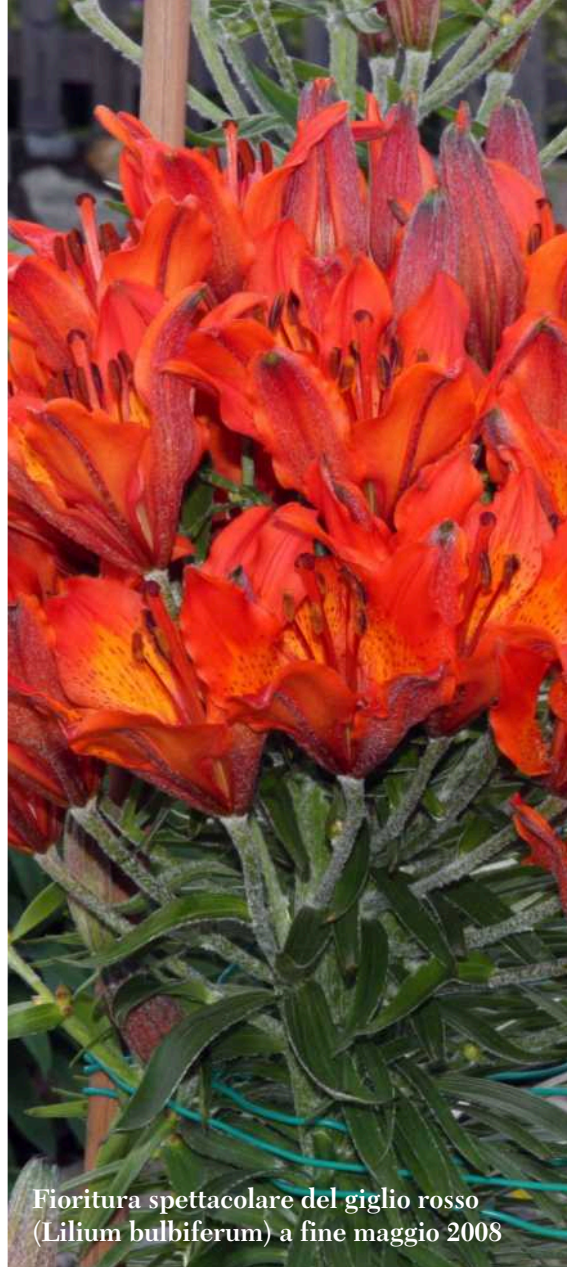
Fioritura spettacolare del giglio rosso ( Lilium bulbiferum ) a fine maggio 2008

Anche alcuni aspetti logistici sarebbero da ottimizzare. E' necessario infatti realizzare una stradina di accesso per far arrivare i mezzi meccanici, necessari alla manutenzione straordinaria, direttamente all'area verde senza dover passare attraverso proprietà private. Nel periodo di siccità estiva infine la quantità d'acqua presente nei serbatoi del giardino botanico spesso non è sufficiente per evitare l'essiccamento di molte specie coltivate. Il recupero dell'acqua della fontana nella piazza antistante la chiesa parrocchiale potrebbe ovviare a questa importante problematica. Confido quindi che la collaborazione tra il Museo civico di Rovereto e il Comune di Brentonico possa proseguire per far crescere ulteriormente l'orto botanico di Palazzo Baisi fino a fargli raggiungere il ruolo che merita.