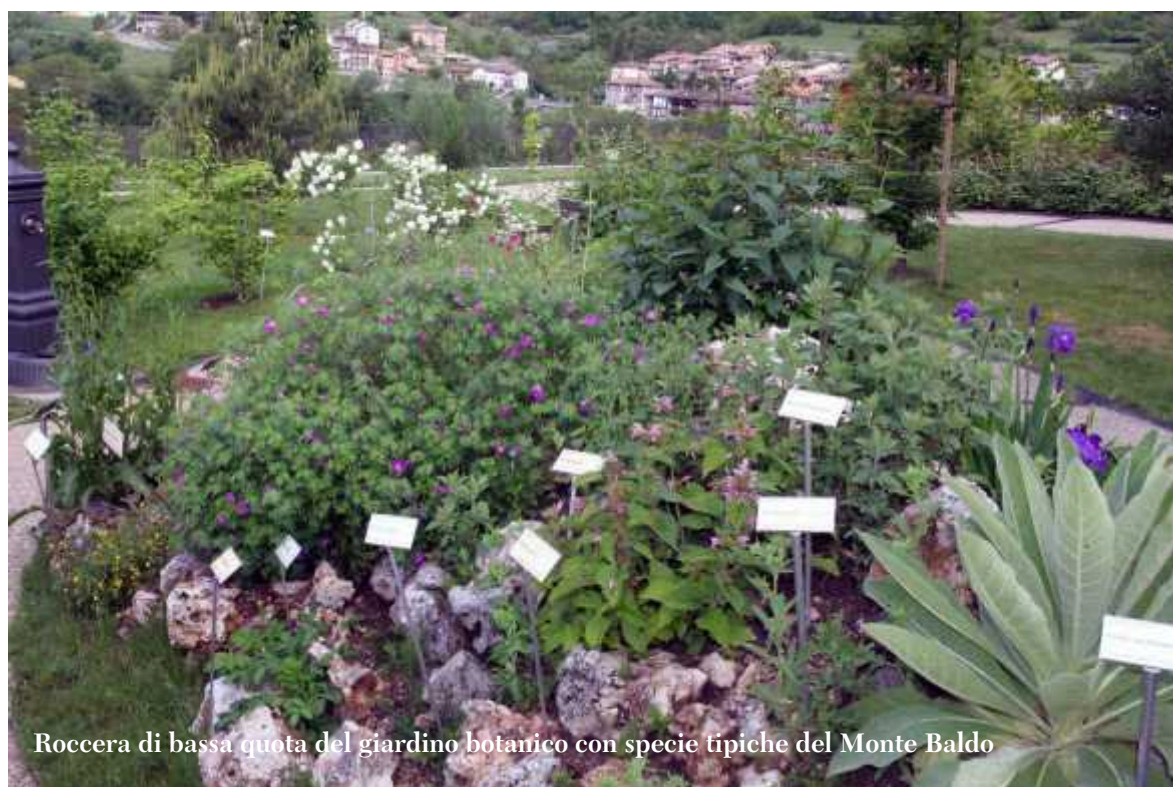
Roccera di bassa quota del giardino botanico con specie tipiche del Monte Baldo